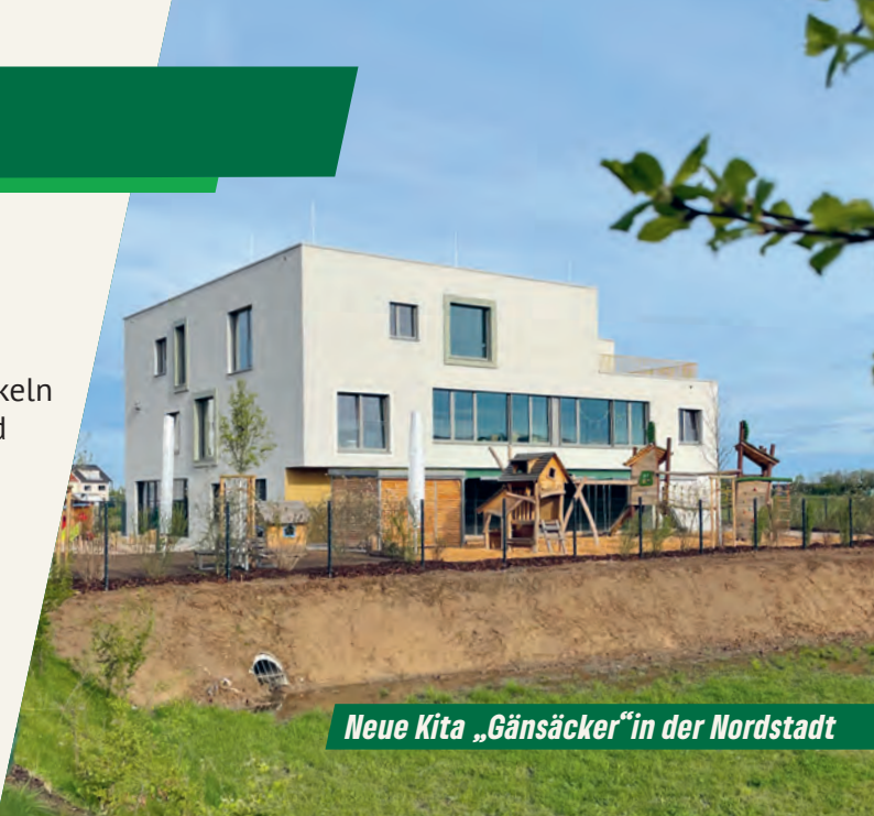
Neue Kita „Gänsäcker“ in der Nordstadt