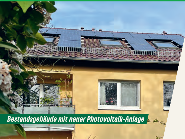
Bestandsgebäude mit neuer Photovoltaik-Anlage