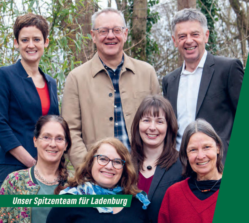
Unser Spitzenteam für Ladenburg