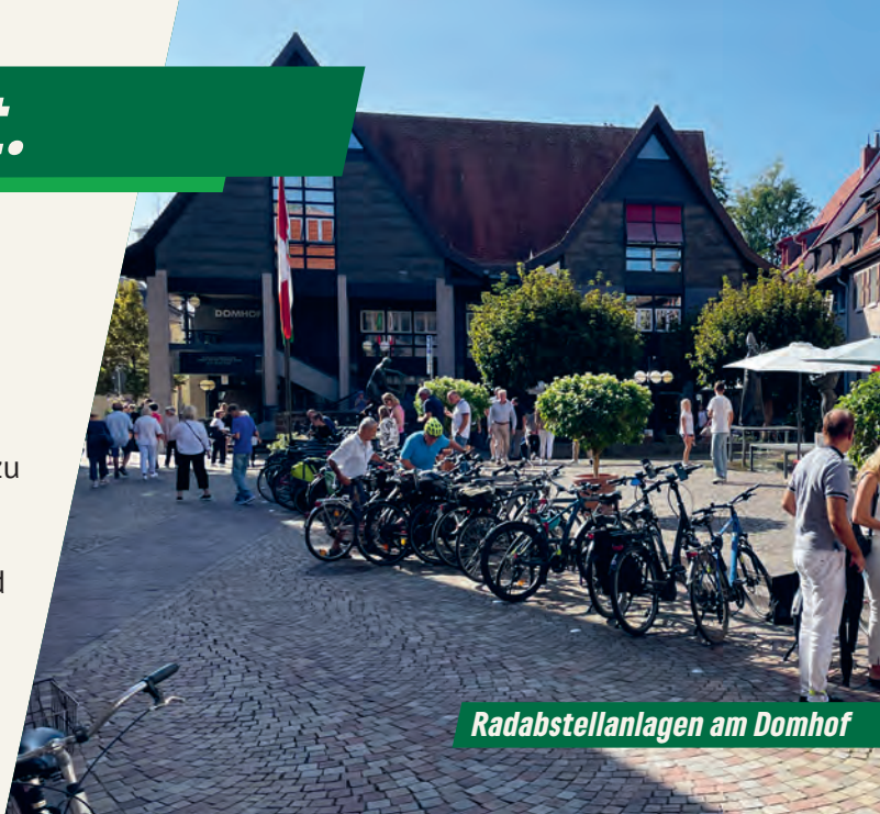
Radabstellanlagen am Domhof